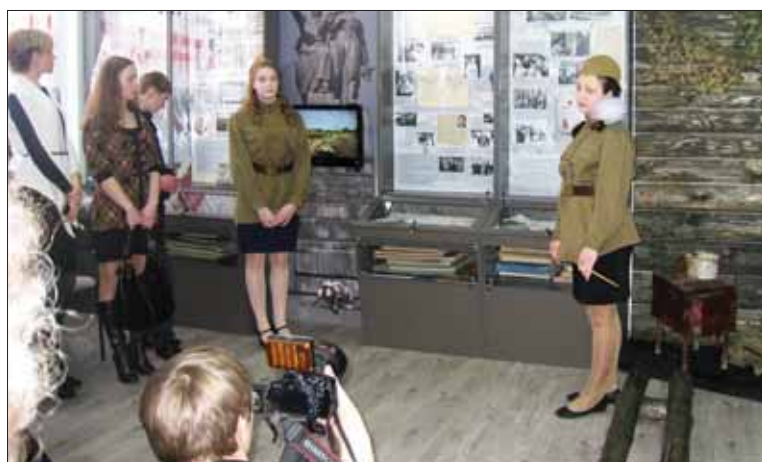
В школьном музее

С 2012 года, согласно указа губернатора Свердловской области, 11 марта Свердловская область ежегодно отмечает знаменательную дату — День народного подвига по формированию Уральского добровольческого танкового корпуса в годы Великой Отечественной войны.