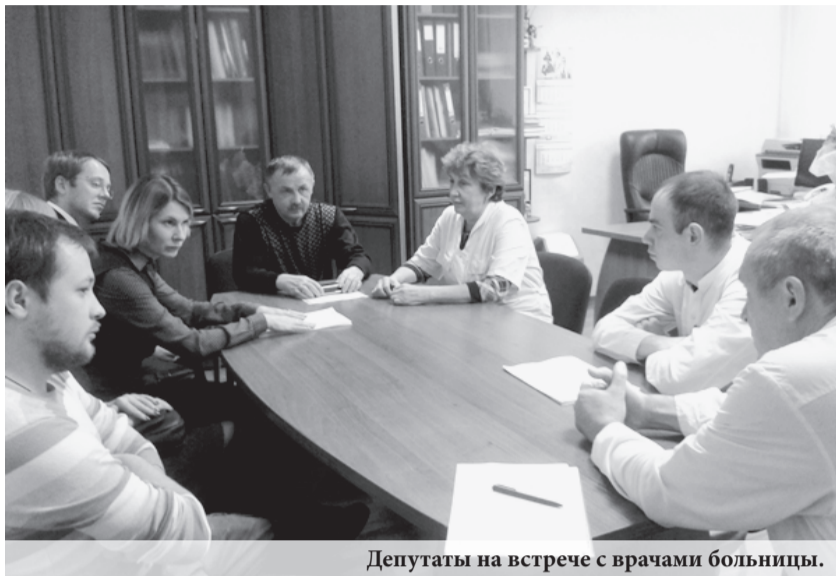
Депутаты на встрече с врачами больницы.

По словам депутата, больница в Бисерти является одной из