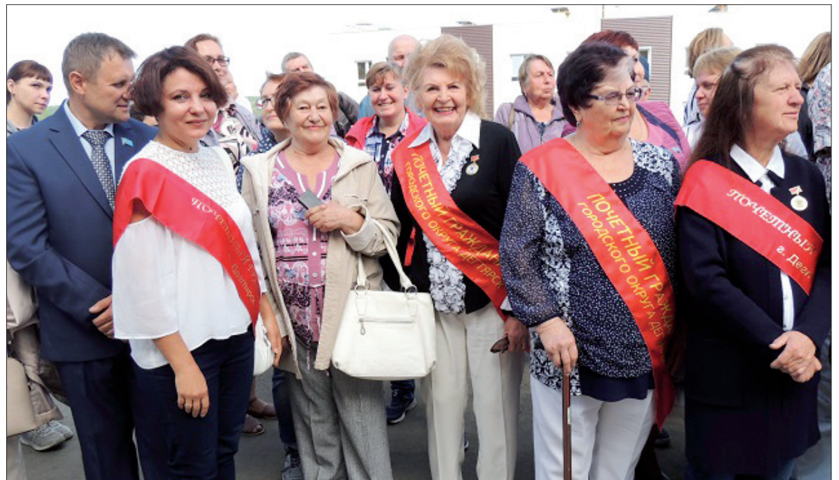
Почётные жители Дегтярска.

Сейчас Почетному горняку уже за 80. Но он бодр и энергичен. Капиталов не нажил, а самым большим богатством считает своих внуков, своих родных и друзей, с которыми за праздничным столом вспомнит былое.