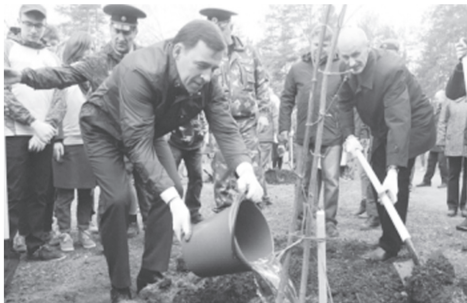
Свердловская область 8 сентября вновь присоединится ко Всероссийскому субботнику «Зеленая Россия». Соответствующее распоряжение подписал глава региона Евгений Куйвашев.

05.00, 09.00, 13.00 Известия 05.25 Х/ф "ВА-БАНК - 2" 16+ 07.05, 08.05, 09.25, 10.15, 11.00, 12.00, 13.25, 14.20, 15.10, 16.05, 17.00, 17.55 Т/с "УЛИЦЫ РАЗБИТЫХ ФОНАРЕЙ" 16+ 18.50, 19.40, 20.20, 21.05, 21.55, 22.45, 23.30, 00.15, 01.05 Т/с "СЛЕД" 16+ 01.50, 02.30, 03.00, 03.30, 04.10, 04.40 Т/с "ДЕТЕКТИВЫ" 16+