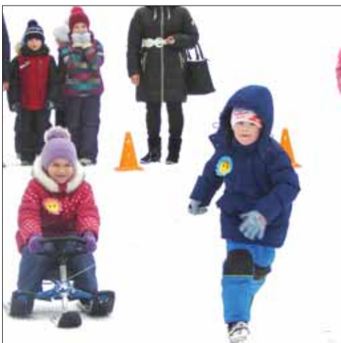
Вперёд! К вершине пьедестала!

12 марта на лыжной базе «Олимп» прошли соревнования «Зимние забавы» среди дошкольных образовательных учреждений города, в которых приняли участие команды почти всех детских садов. Остался в стороне лишь детский сад № 38 из-за карантина.