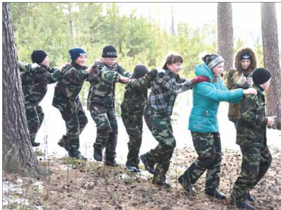
С поддержкой команды — не страшно!

РЕЗУЛЬТАТЫ СПОРТИВНОЙ ИГРЫ: Младшая группа (5 классы): 1 место – 5А класс, 2 место – 5Б класс. Среднее звено (6-7 классы): 1 место – 6Б класс, 2 место – 7Б класс, 3 место – 6А класс. Старшая группа (8-10 классы): 1 место – 10 класс, 2 место – 8Б класс, 3 место – 8А класс.