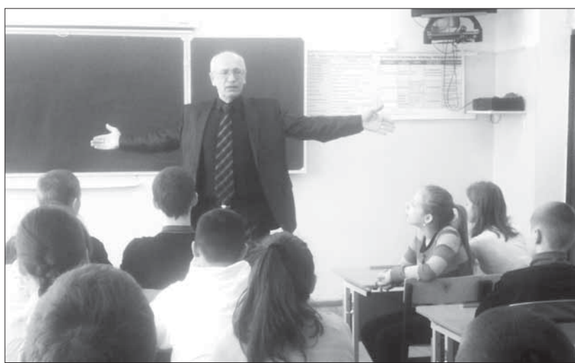
Ученики с интересом слушали именитого гостя