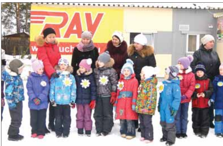
Спортивный дух и вера в победу поддерживали воспитанников детсадов!