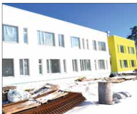
НОВОЕ ЮРИДИЧЕСКОЕ ЛИЦО - ДЕТСАД № 1