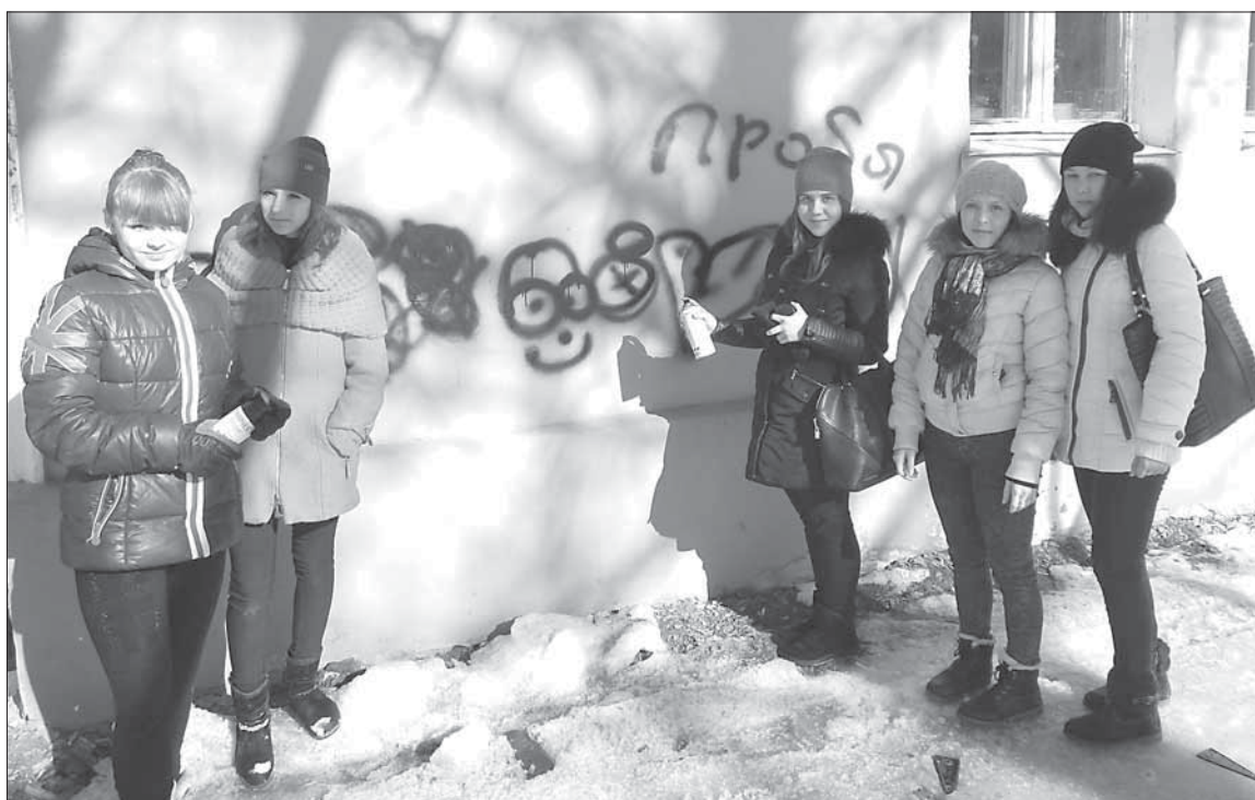
Молодёжь Дегтярска приняла активное участие в антинаркотической кампании

В течение двух недель организаторы принимали анонимные звонки от граждан, которые сообщали адреса домов, где написаны «наркономера». В субботу 45 активистов города вооружились баллончиками с краской и вышли на улицы, чтобы закрасить провокационные надписи. Получив инструкции и разделившись