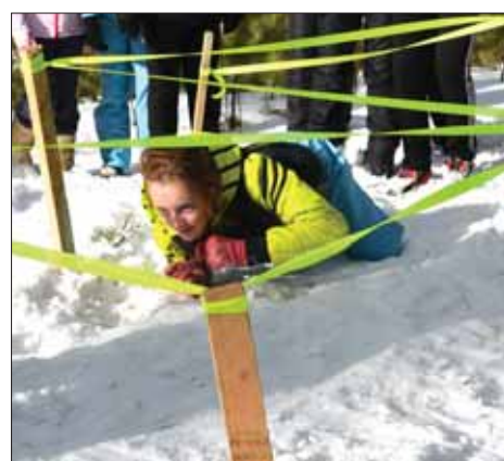
«СНЕЖНЫЙ ДЕСАНТ» УСПЕШНО ПРОШЕЛ ИСПЫТАНИЯ