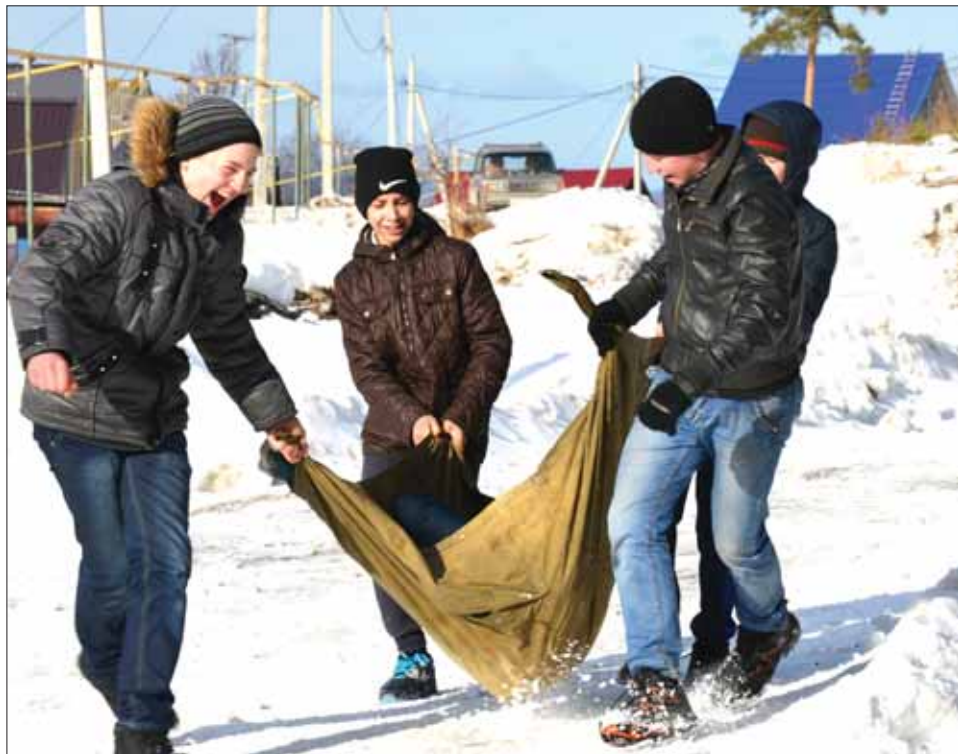
Спасение идет полным ходом

День рождения Уральского Добровольческого танкового корпуса школы №30 ежегодно отмечает большой спортивной игрой с названием «Снежный десант». Название, стоит сказать, полностью соответствует мероприятию – ребята по командам десантируются в лес, полный еще не успевшего растаять снега.