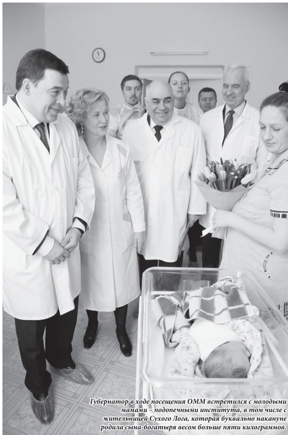
Губернатор в ходе посещения ОММ встретился с молодыми мамами – подопечными института, в том числе с жительницей Сухого Лога, которая буквально накануне родила сына-богатыря весом больше пяти килограммов.

Исправить ситуацию помогут передвижные мобильные комплексы, которые будут работать в территориях. Сейчас приобретены 5 таких автомобилей: в Первоуральске, Нижнем Тагиле, Ирбите, Каменске-Уральске и Краснотурьинске. В ближайшее время предстоит оснастить их необходимым оборудованием для оказания первичной помощи в мобильном варианте.