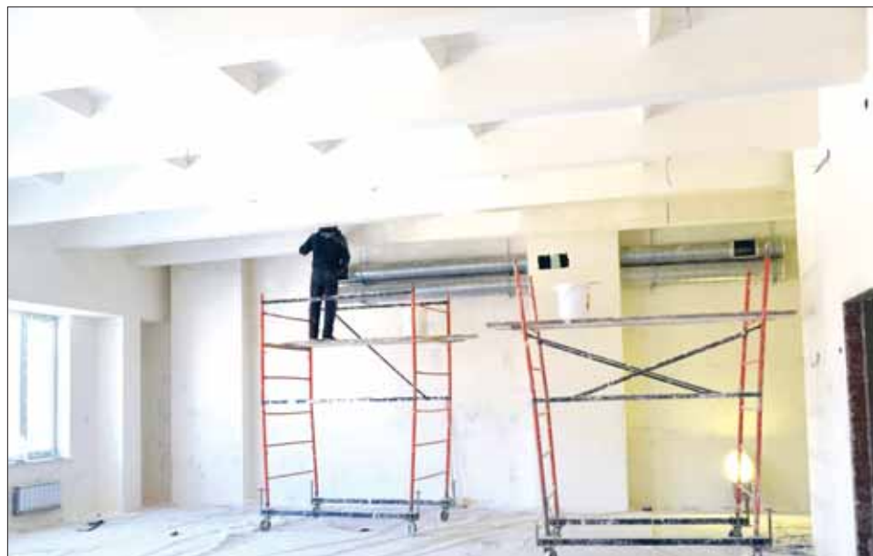
Продолжается чистовая отделка помещений