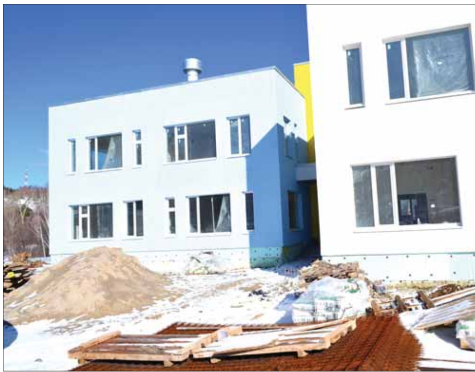
Наружная отделка здания детсада завершена

Комфортабельный новый детский сад ждут сто пятьдесят детей из г.Дегтярска, шесть групп по 25 ребят. Предварительно, по условиям муниципального контракта, объект должен быть введен в эксплуатацию не позднее 1 сентября. Красивые завораживающие стены детсада вызывают неподдельный интерес: а как обстоит дело внутри здания? На каком этапе находится окончательная стадия строительства? В обязанности подрядной фирмы входит весь комплекс работ от нулевого цикла до сдачи части объекта «под ключ».