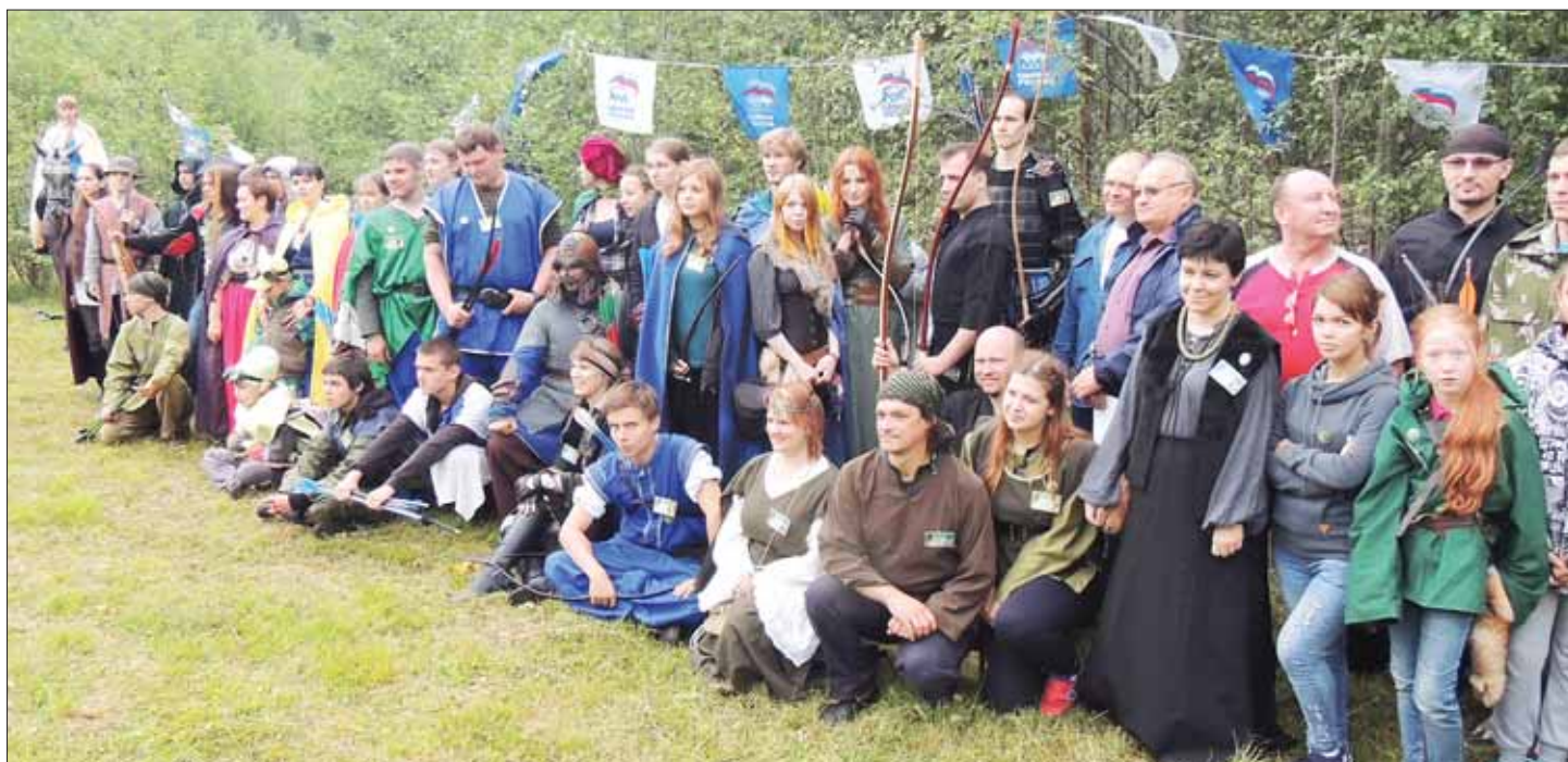
Народу было так много, что в кадр все не вместились