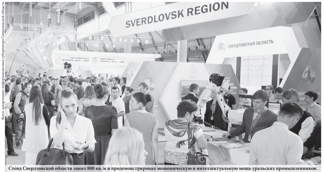
Стенд Свердловской области занял 800 кв. м и продемонстрировал экономическую и интеллектуальную мощь уральских промышленников.

С каждым годом Международная промышленная выставка ИННОПРОМ становится всё более интересной для топ-менеджеров и крупных инвесторов. По словам организаторов, здесь участвовали представители 95 стран. От страны-партнёра Индии в деловой программе приняли участие более 100 руководителей компаний. Китайская делегация насчитывала более 3 тысяч человек. Глава Минпромторга РФ Денис Мантуров также высоко оценил лоббистские усилия губернатора Среднего Урала по продвижению интересов свердловских промышленников. «Евгений Куйвашев активно продвигает продукцию предприятий региона не только на российском рынке, но и на межгосударственном уровне», – сказал Денис Мантуров.