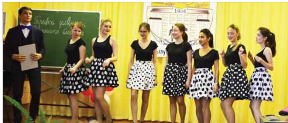
Очаровательная команда «Стиляги»

В конце прошлой недели в актовом зале школы №16 яблоком негде было упасть. Ещё бы – КВН, посвященный году российского кино. Встречались в клубе веселые и находчивые команды выпускников и десятиклассников, а вернее – «Стиляги» и «Пираты двадцатого века». Какая-то команда была признана самой сплоченной и дружной, а другая – самой позитивной, поразив всех своим стилем, юмором и обаянием!