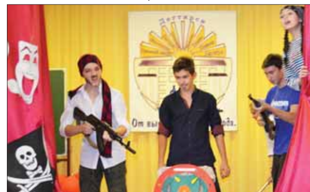
Задорная команда «Пираты двадцатого века»

По ходу КВНа команды участвовали в викторине по истории российского кино. А в конкурсе капитанов члены команды угадывали по пантомимам своего лидера название фильмов. Капитанам пришлось нелегко, пришлось использовать свою находчивость по полной! Закончилось состязание по-