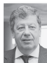
Аркадий Чернецкий, член Совета Федерации:

«Губернатор назвал бюджетную политику следующего года «жёсткой», и это оправданный подход в нынешних экономических условиях. Это значит, что при формировании и утверждении бюджета мы должны очень продуманно расставить приоритеты развития Свердловской области, как в экономике, так и в социальной сфере, чтобы регион максимально эффективно развивался и поднимался на более высокие ступени».