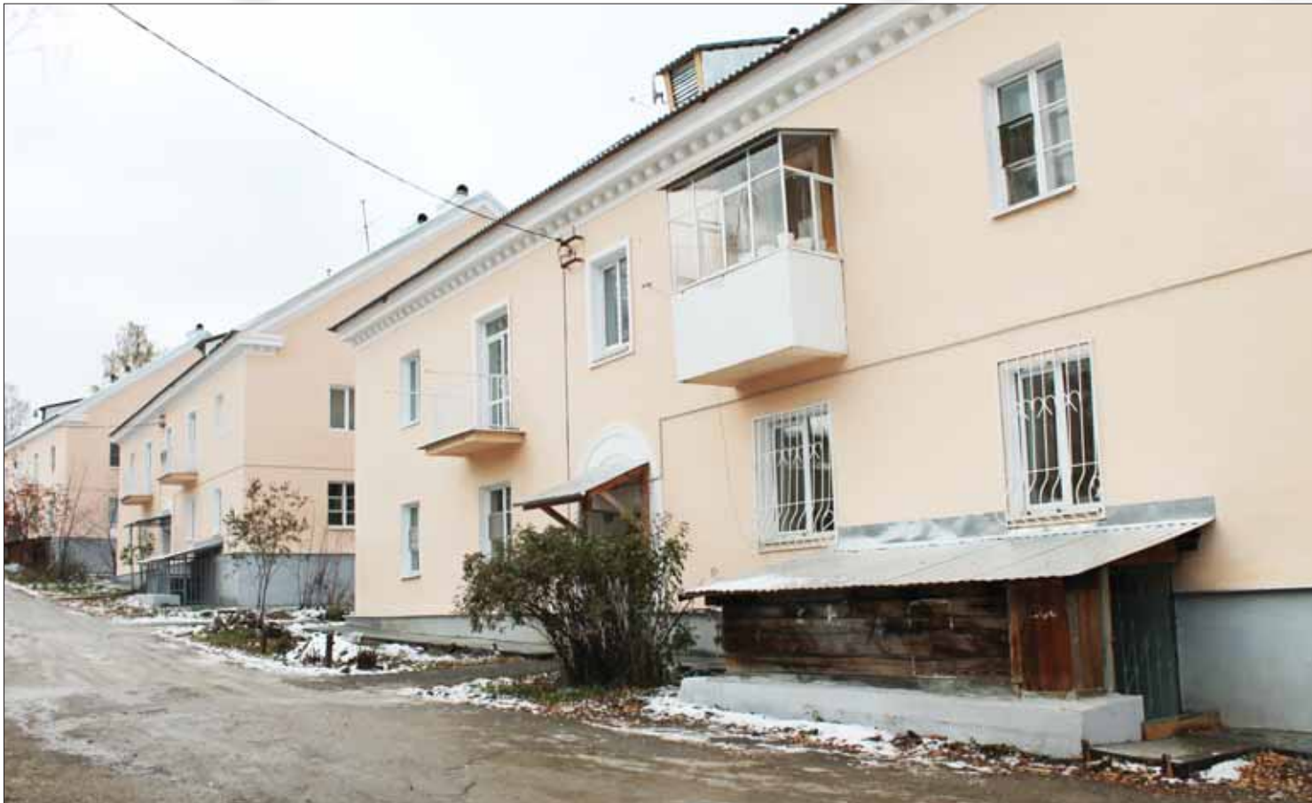
Красивые дома №1, 3, 5 по ул. Пл. Ленина радуют жильцов теплом, комфортом и чистотой

Первого сентября управляющая компания ООО «Ремстройкомплекс» и ТСЖ «Край» приняли на содержание и обслуживание дома по ул. Пл. Ленина, 1, 2, 3, 4, 5 и ул. Калинина, 42, прошедшие капитальный ремонт.