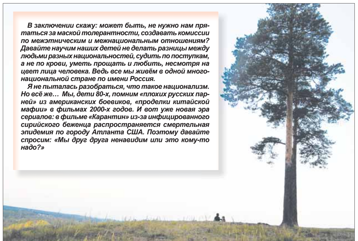
С высоты птичьего полёта

Я не пыталась разобраться, что такое национализм. Но всё же... Мы, дети 80-х, помним «плохих русских парней» из американских боевиков, «проделки китайской мафии» в фильмах 2000-х годов. И вот уже новая эра сериалов: в фильме «Карантин» из-за инфицированного сирийского беженца распространяется смертельная эпидемия по городу Атланта США. Поэтому давайте спросим: «Мы друг друга ненавидим или это кому-то надо?»