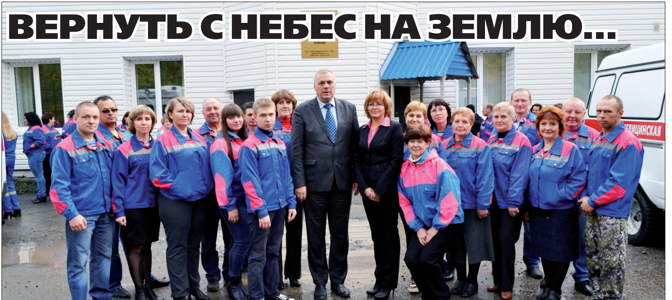
Подстанция №2 г.Дегтярска Ревдинской станции скорой медицинской помощи. 2016 г.

Уважаемые земляки! Дорогие ветераны Великой Отечественной войны, труженики тыла, наше старшее поколение! Сердечно поздравляю вас с наступающим Днём Великой Победы! От души желаю крепкого здоровья, долгих лет жизни, любви и внимания близких, мирного неба!