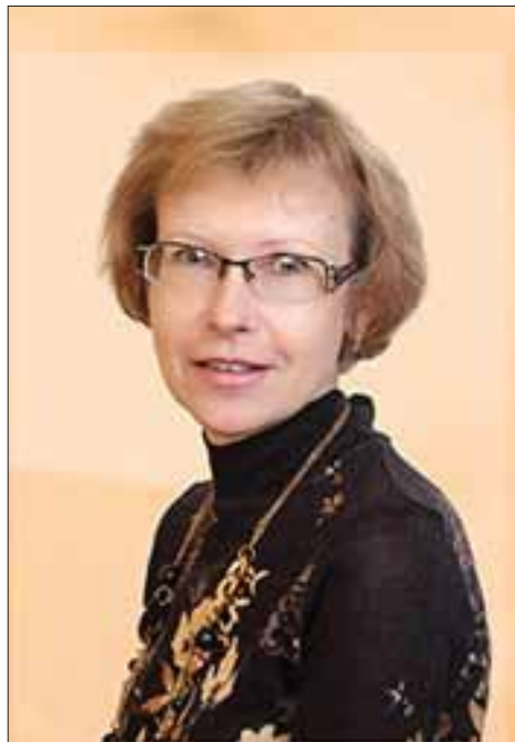
Сегодня за плечами этого человека плодотворный учительский труд, глу-