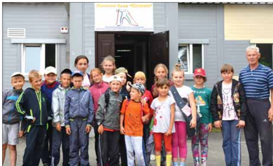
Самые высокие спортивные достижения ещё впереди!