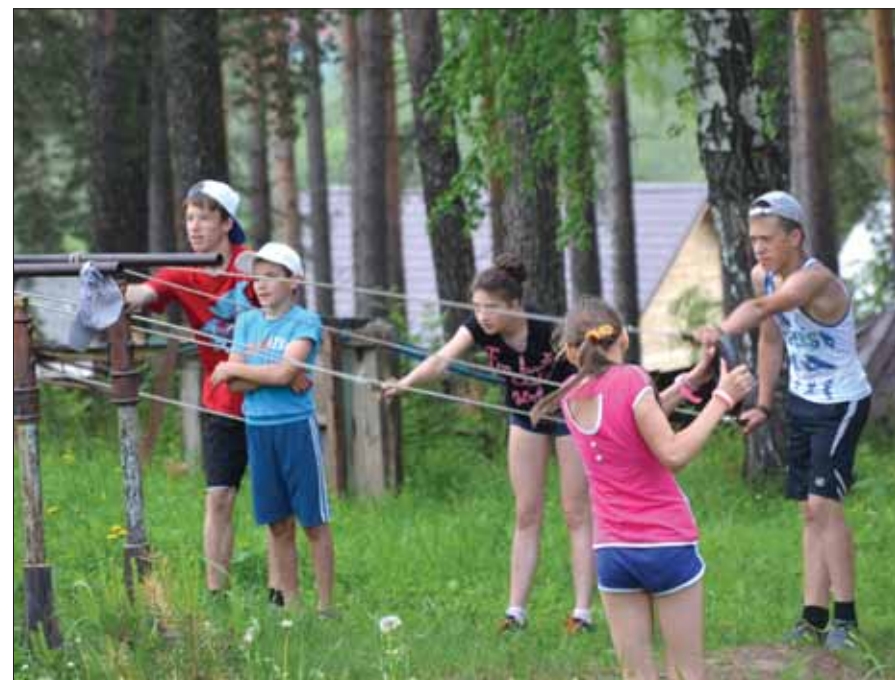
Ребята усиленно тренируются каждый день

Силами Управления культуры и спорта в июле впервые организуется спортивно-оздоровительный лагерь дневного пребывания на базе МКУ «ФОК». В течение пяти дней 30 детей - участников лыжной спортивной секции - будут усиленно тренироваться и питаться, набираясь сил и здоровья.