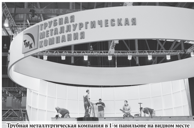
Трубная металлургическая компания в 1-м павильоне на видном месте

В дни проведения выставки организованы специальные автобусные рейсы для посетителей выставки. Городские автобусы будут курсировать в даты выставки 11-14 июля: От станции метро «Ботаническая» до МВЦ «Екатеринбург-ЭКСПО» с 09:00 до 19:30 с интервалом 20 минут. От МВЦ «Екатеринбург-ЭКСПО» до станции метро «Ботаническая» с 09:35 до 20:00 с интервалом 20 минут.