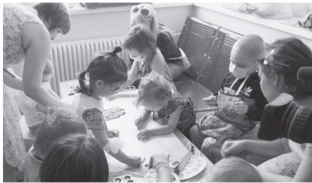
В центре детской онкологии и гематологии ОДКБ №1 в рамках проекта «Искусство против рака» прошло увлекательное занятие, это помогает отвлечь маленьких пациентов от больничных будней.

Первое в Екатеринбурге и восьмое в Свердловской области отделение паллиативной помощи открылось в ЦГБ № 2 имени Александра Миславского.