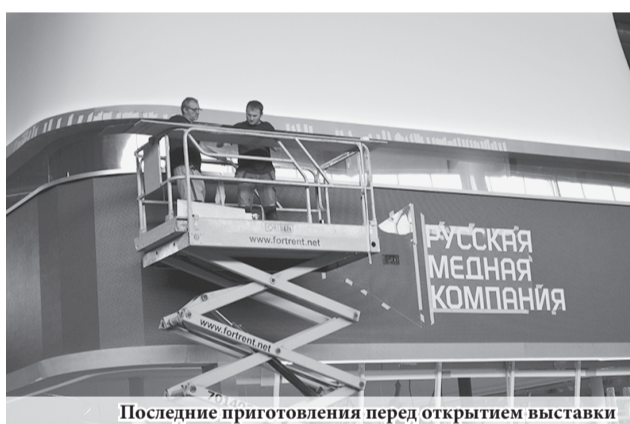
Последние приготовления перед открытием выставки