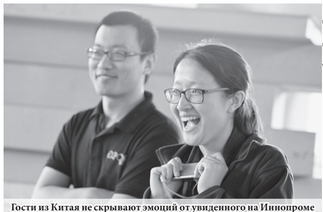
Гости из Китая не скрывают эмоций от увиденного на Иннопроме