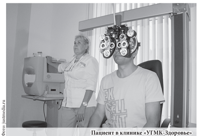
Пациент в клинике «УГМК-Здоровье»

Оренбургские врачи смогли ознакомиться с организацией современной лучевой диагностики, увидели стройку второй очереди медицинского